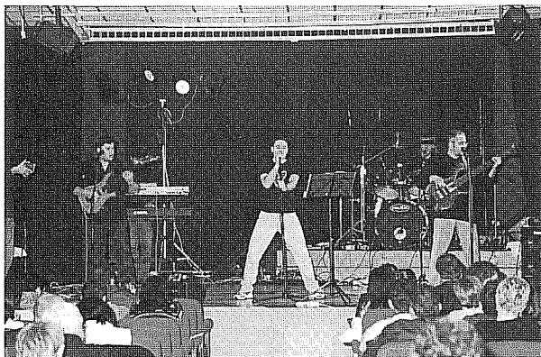
I Matrix in concerto