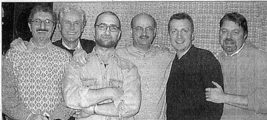
I Gseven (nella foto) e gli altri gruppi vogliono aiutare concretamente la Lega friulana per il cuore

Sabato Soundstrack, Gseven, Bad memory e Matrix