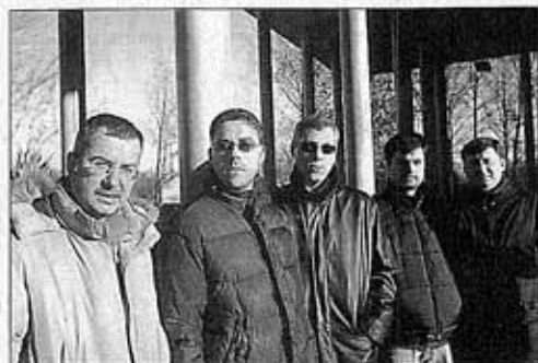
I Matrix sono uno dei gruppi protagonisti di Musicassieme 2004

"Mi auguro che quest'anno - conclude Taurino - l'iniziativa riscuota ancora maggior successo. Anzi, vorrei proprio che il pubblico e la cifra raccolta raddoppiassero, in modo da rendere questo un appuntamento importante per il mondo del volontariato. E poi ho un sogno, spero realizzabile, per l'edizione 2005: il teatro Giovanni da Udine". A buon intenditor..."